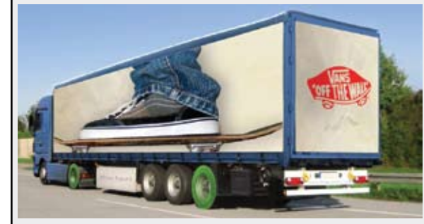
Vans of the wall: Yarışma ikincisi.