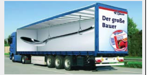
Löffel: Yarışma yedincisi.