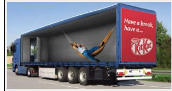
Have a break: Yarışma birincisi.