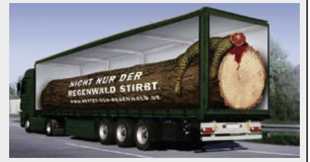
Nicht nur der Regenwald stirbt.