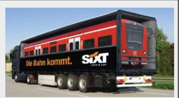
Die Bahn kommt: Yarışma altıncısı.

neredeşey tüm bloglarda yer verilmiş durumda. Her ne kadar Türkiye'de pek fazla örneklerine rastlayamasa da, görmemiş olabilecek tasarımcılar için konuyu bir kez daha gözler önüne sermek istedim. Daha fazla örnek için; "rhino-award.com" sitesini ziyaret edebilirsiniz.